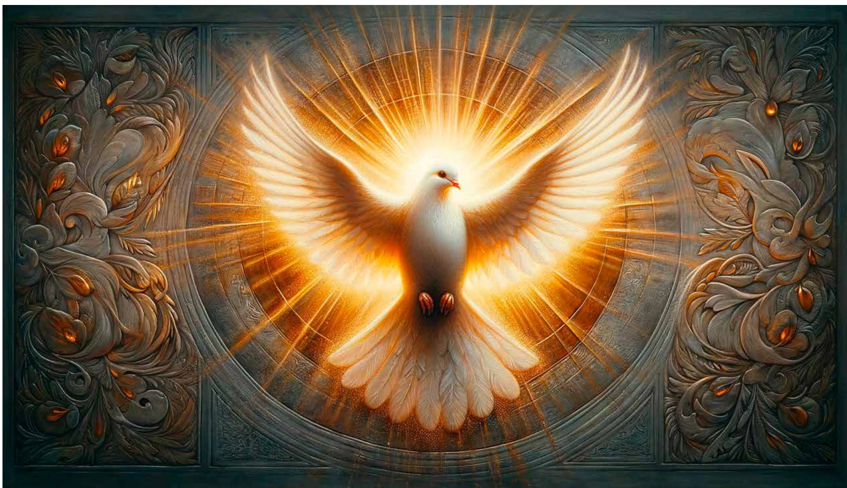
KI-GENERIERTES BILD ZUM STICHWORT «PFINGSTEN».